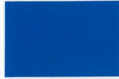
C-01ロイヤルブルー (透光率0%)