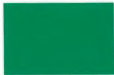
C-09フォレストグリーン (透光率0%)