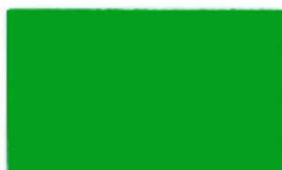
T-09 フォレストグリーン [透光率:0.2%]