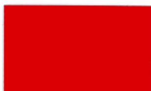
T-13 レッド [透光率:0.7%]