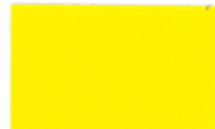
T-11 イエロー [透光率:5.9%]